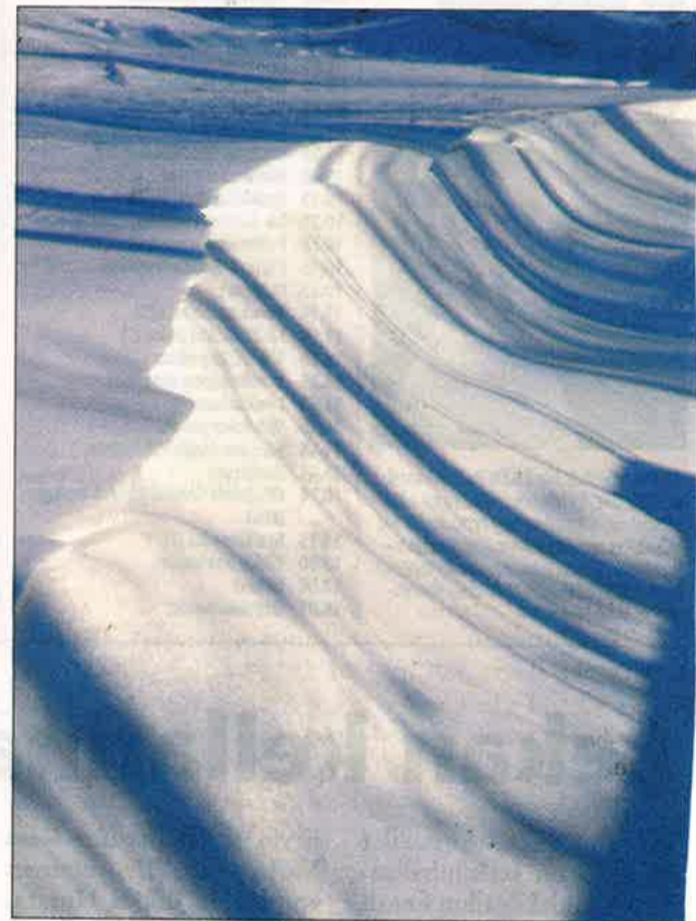
Antti Seppälä "Viivakoodi".