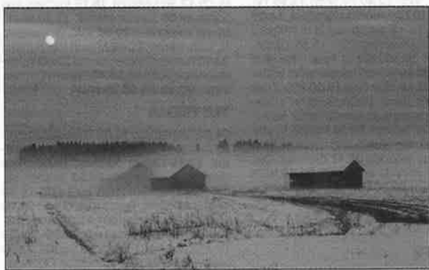
Juha Merenheimo har fotat ett vintrigt landskap.

LOVISA Lovisa Kameraklubben inledde det nya året på ett traditionellt sätt. På den första bildkvällen visades projicerade bilder. Ämnet var fritt och sammanlagt 24 bilder deltog i tävlingen.