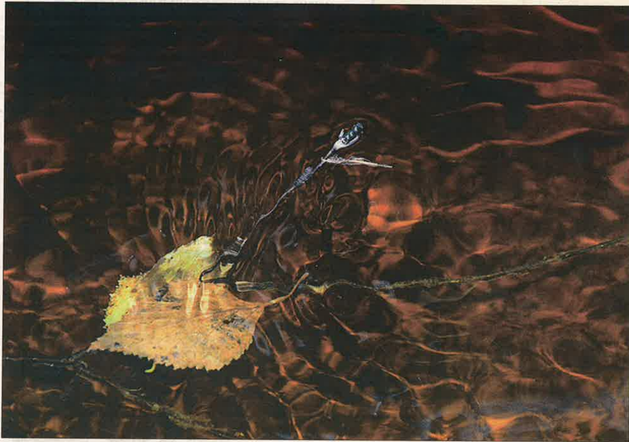
Antti Seppäläs "Lehti joessa" ("Ett blad i floden").