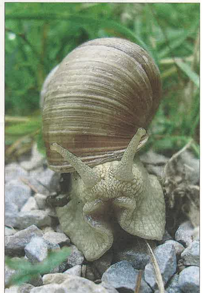
Venla Myller "Etana"