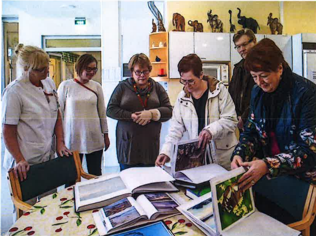
Valokuvien luovutus Loviisan terveyskeskuksen osastolla

Loviisan terveyskeskuksen Osasto (entinen osasto 3) ja Loviisan kameraseura ovat tehneet yhteistyötä potilaiden iloksi.