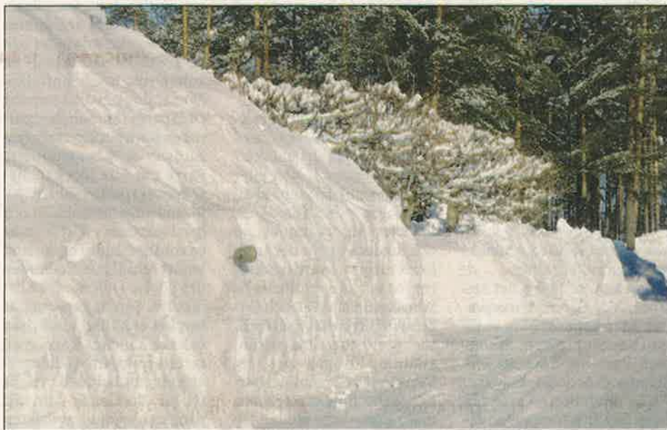
Kupla av Antti Seppälä tog första plats bland färgbilderna.

1) Kevyet pilvet, raskaat kivet, Ari Haimi, 2) Karun maiseman kaunistus, Esko Silvennoinen, 3) Vuori, Kerstin Hafrén, 4) Venevaja, Bosse Boström, 5) Kyllä talvi puhdistaa, Esko Silvennoinen, 6) Cruise terminal, Maj-Len, Eriksson. -ÖN