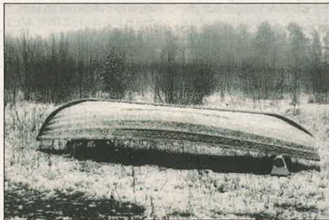
Karun maiseman kaunistus av Esko Silvennoinen