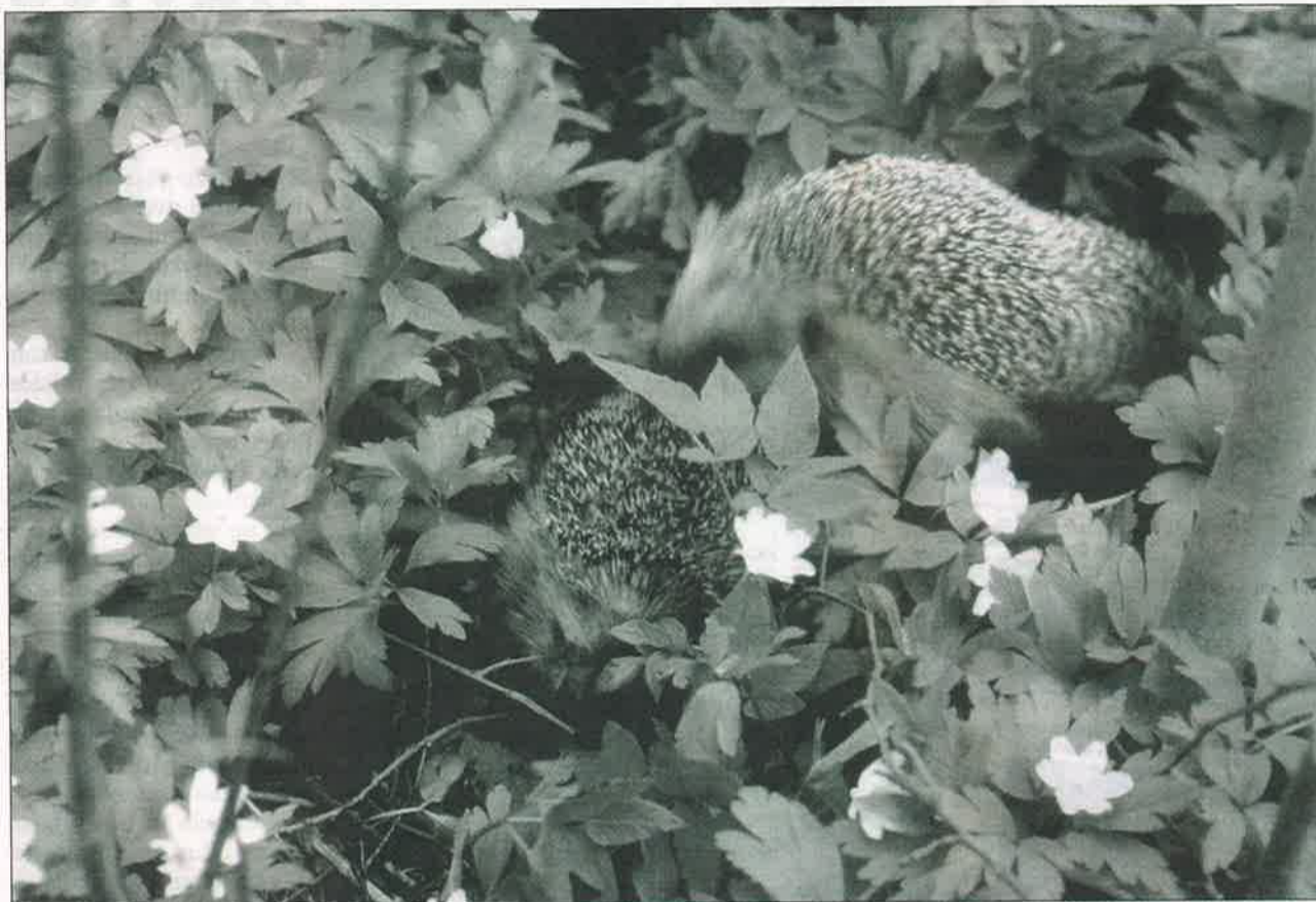
Bosse Boström "Kevätaskareita puutarhassa"