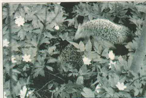
Första plats i bilderna med vårsysslor gick till Bosse Boströms bild "Kevätaskareita puutarhassa".

Innan sommarsemestrarna arrangeras ännu en bildkväll den 29 maj klockan 18. Temat är då "Torgliv" (bildserie, projiserande 3-5 bilder).