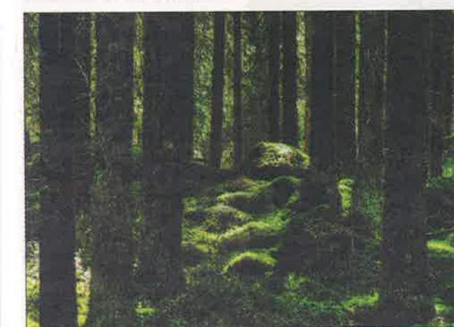
Antti Seppälä "Satumetsä"