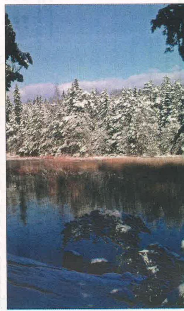
Bosse Boström "Jäätymispiste"