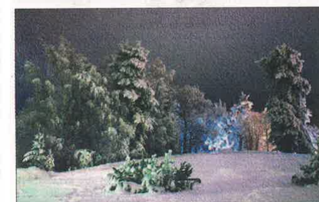
Esko Silvennoinen "Valoa Harjun metsässä"