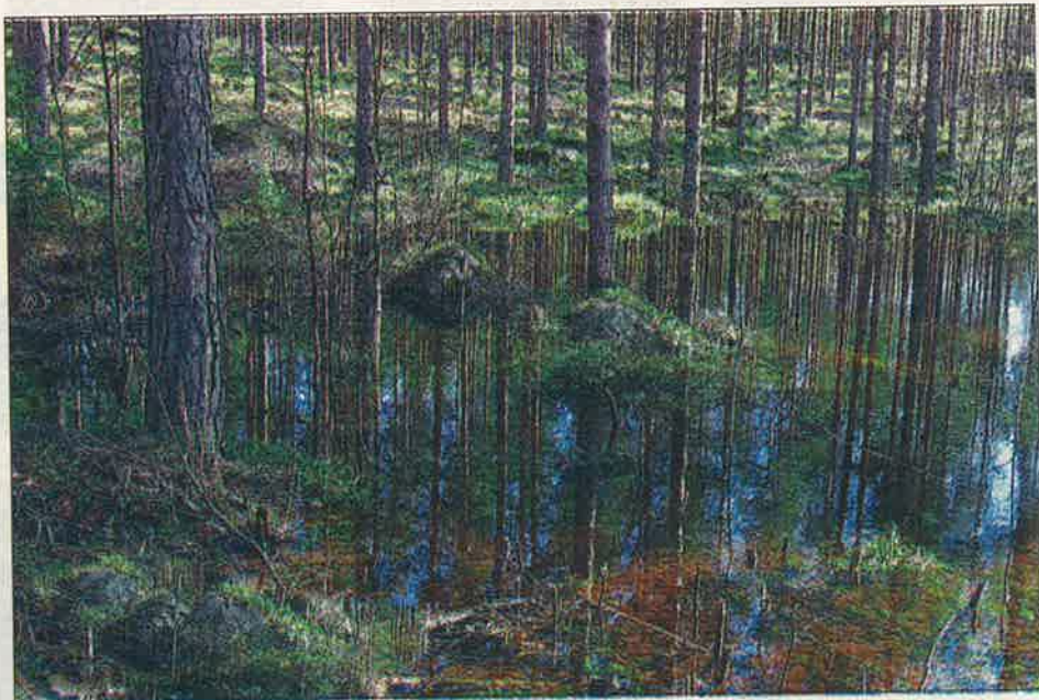
Kerstin Hafréns bild "Monimuotoinen" var bäst i serien med skogsbilder.

Temat för färgbilderna var "skog". Av bilderna att döma ser man att skogen är mångsidig. Den ser olika ut under alla årstider. Där finns olika djur och växter, och ibland ger skogen ett trolskt intryck. Skogen