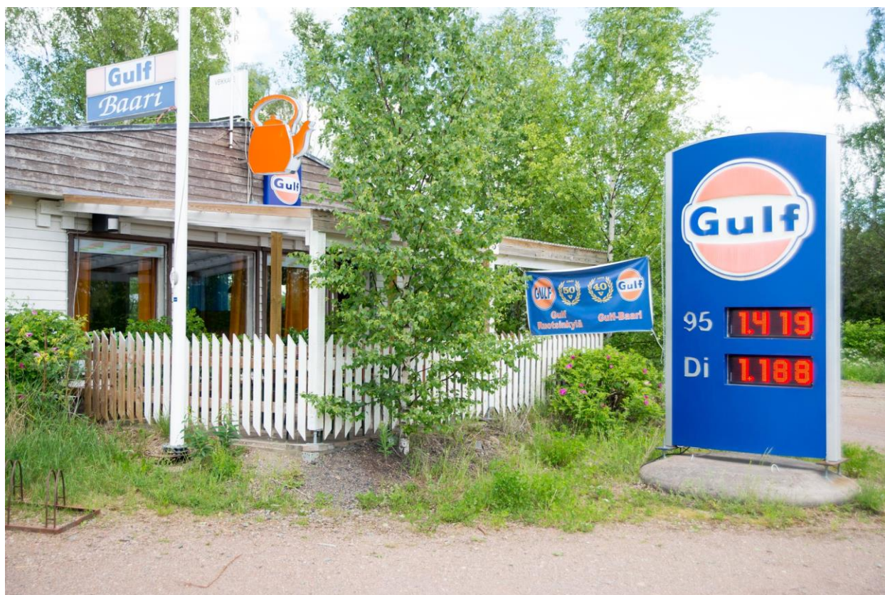
Myös legendaarinen Gulfin baari Ruotsinkylässä tuli tällä kuvausretkellä tutuksi