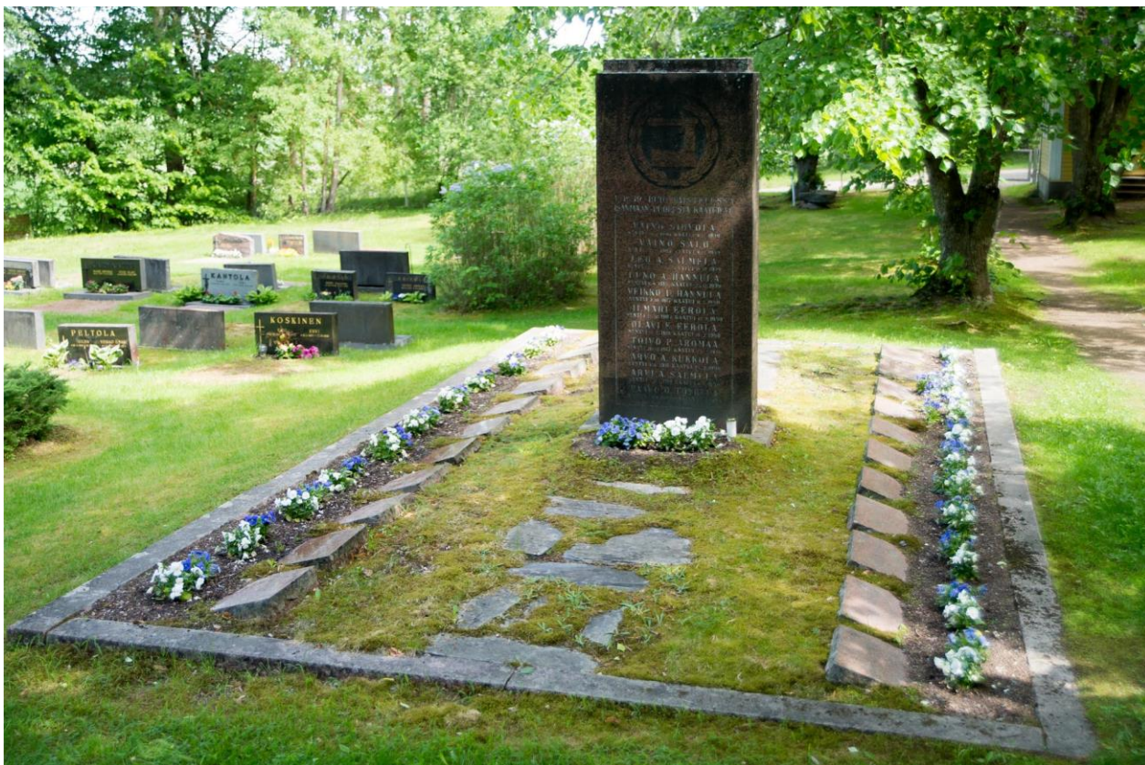
Haaviston sankarivainajien hautausmaalle ei edes Loviisan ympäristön asukas helposti löydä