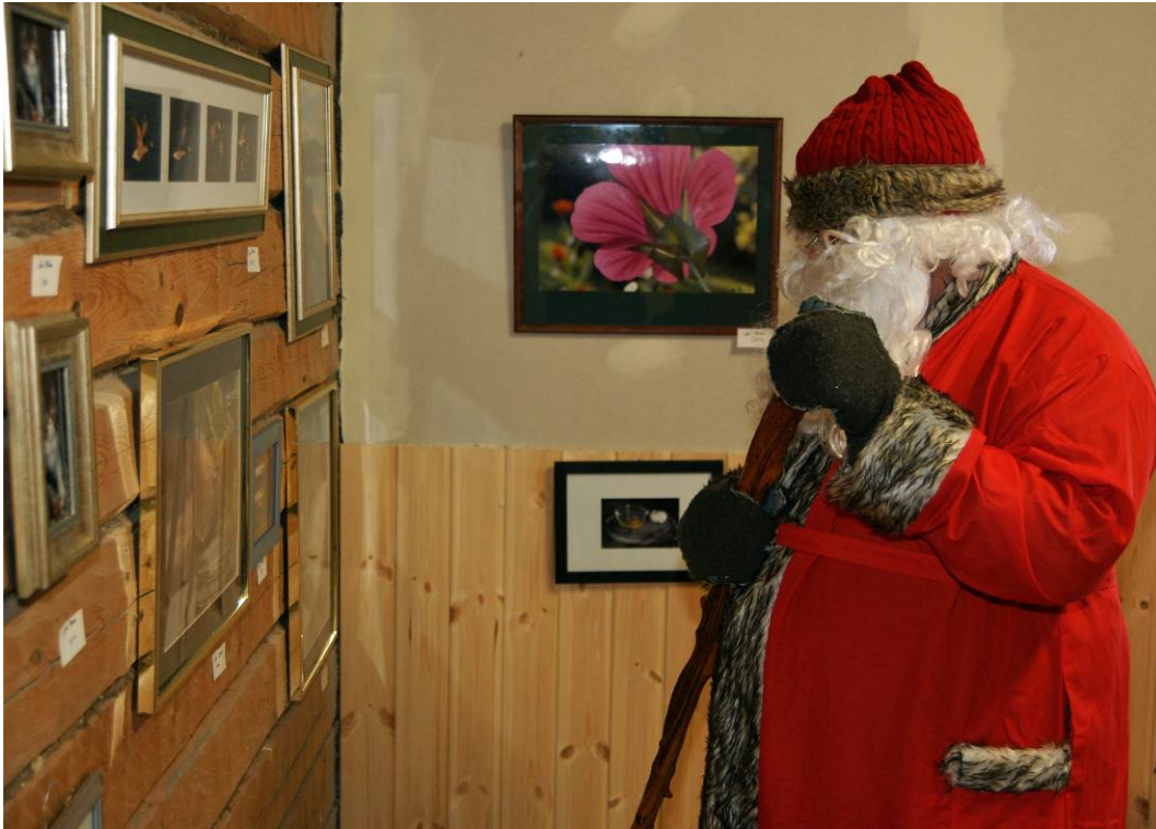
Korvatunturin vieras tutustuu Loviisan Kameraseuran myyntinäyttelyyn Almin talolla